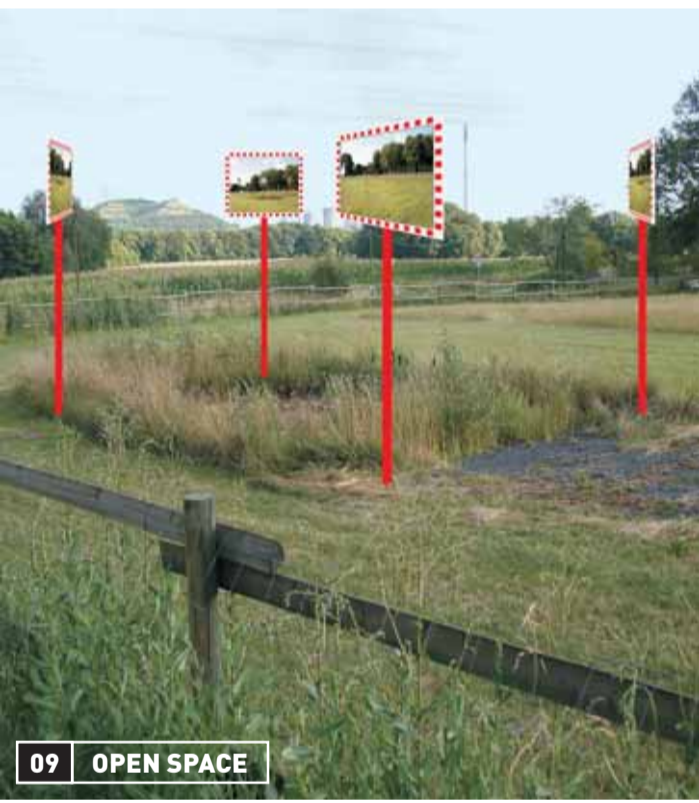
09 OPEN SPACE