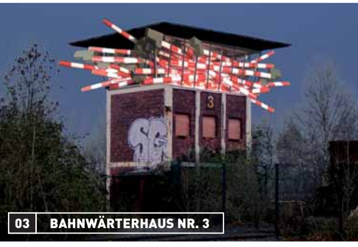
03 BAHNWÄRTERHAUS NR. 3