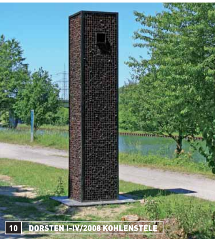
10 DORSTEN I-IV/2008 KOHLENSTELE