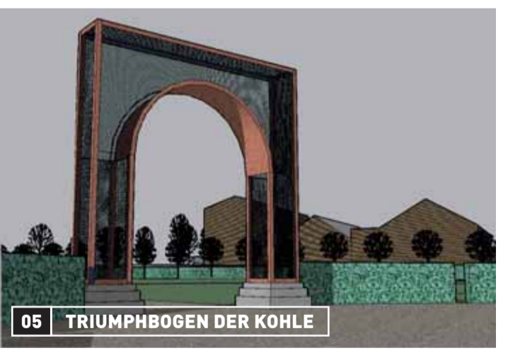
05 TRIUMPHBOGEN DER KOHLE