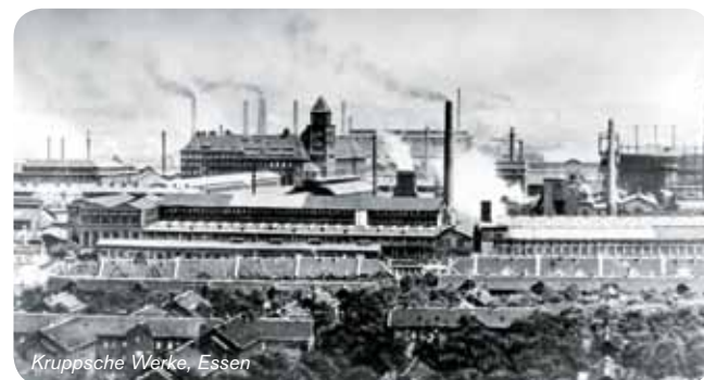
Kruppsche Werke, Essen

Buchungen unter: 0201 8872333 touristikzentrale@essen.de www.essen-marketing.de