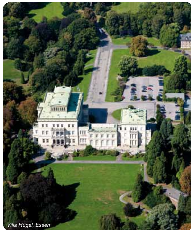
Villa Hügel, Essen

Buchungen unter: 0201 8872333 touristikzentrale@essen.de www.essen-marketing.de