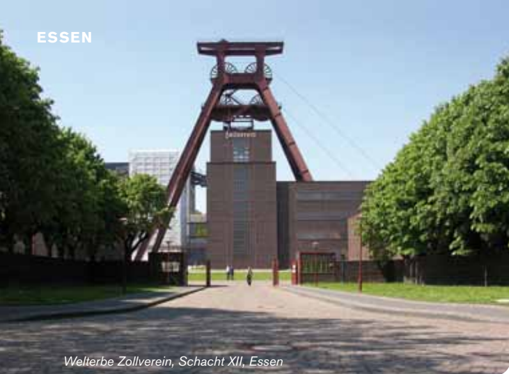
Welterbe Zollverein, Schacht XII, Essen