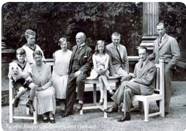
Familie Krupp von Böhlen und Halbach