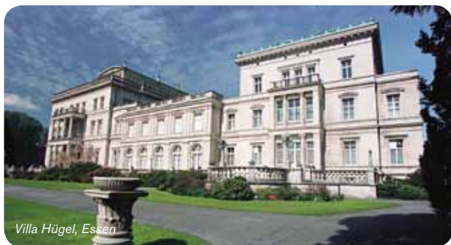
Villa Hügel, Essen

Buchungen online unter: www.ruhr-tourismus.de/reisen-buchen