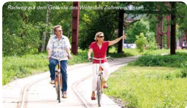
Radweg auf dem Gelände des Welterbes Zollverein, Essen

Treffpunkt: Haltestelle ThyssenKrupp ThyssenKrupp Allee 1 | 45143 Essen Buchung unter: 0201 5641004 | www.simply-out-tours.de