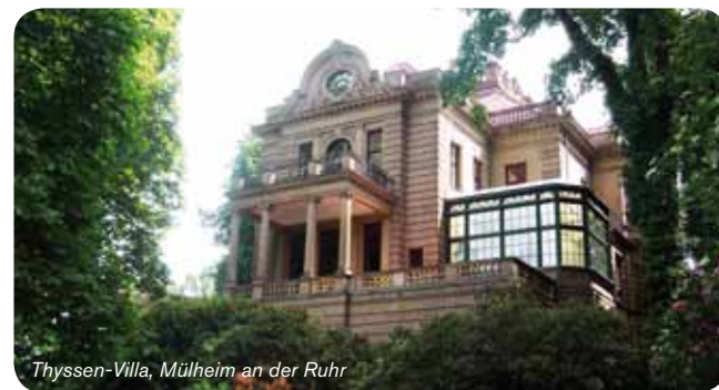
Thyssen-Villa, Mülheim an der Ruhr

Termin: 19.06.2011 – Dauer: 6 Stunden – 32,- € p.P.